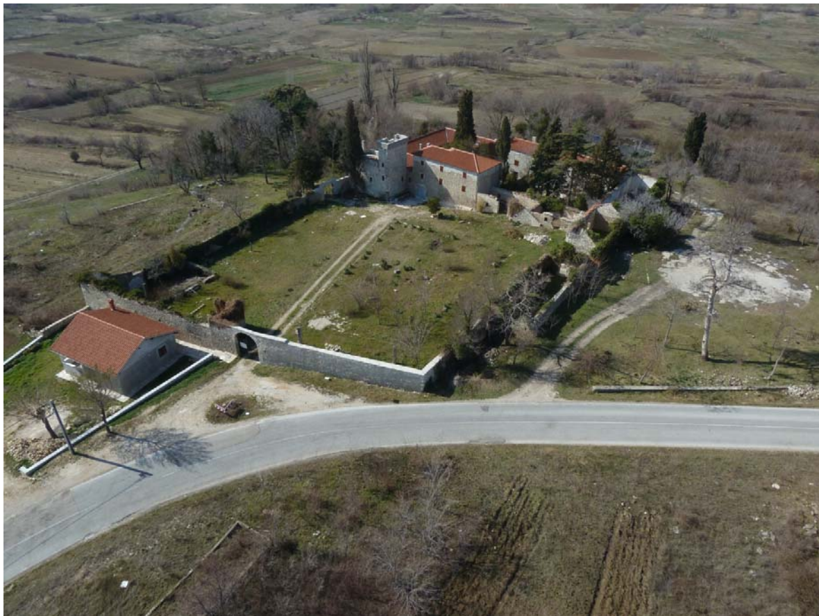
sl. 1. Kula Jankovića – pogled iz zraka, 2012.