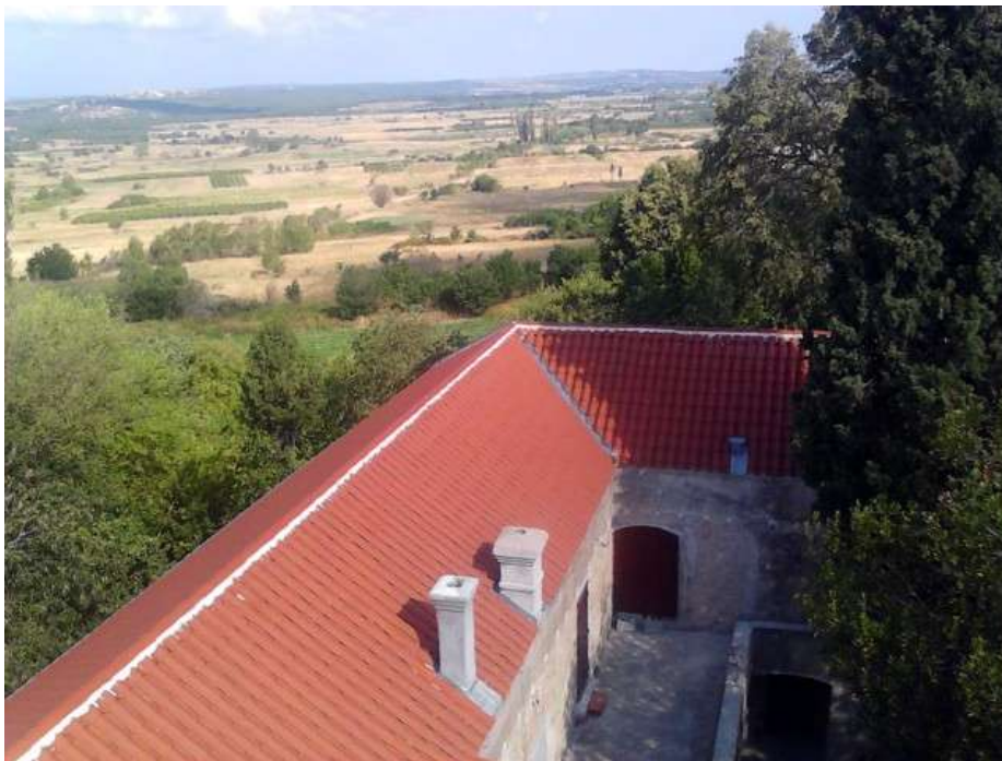
Ravni Kotari s Kule