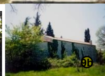
'Magazin', a sjevera