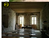
'Sala', 2011. g.