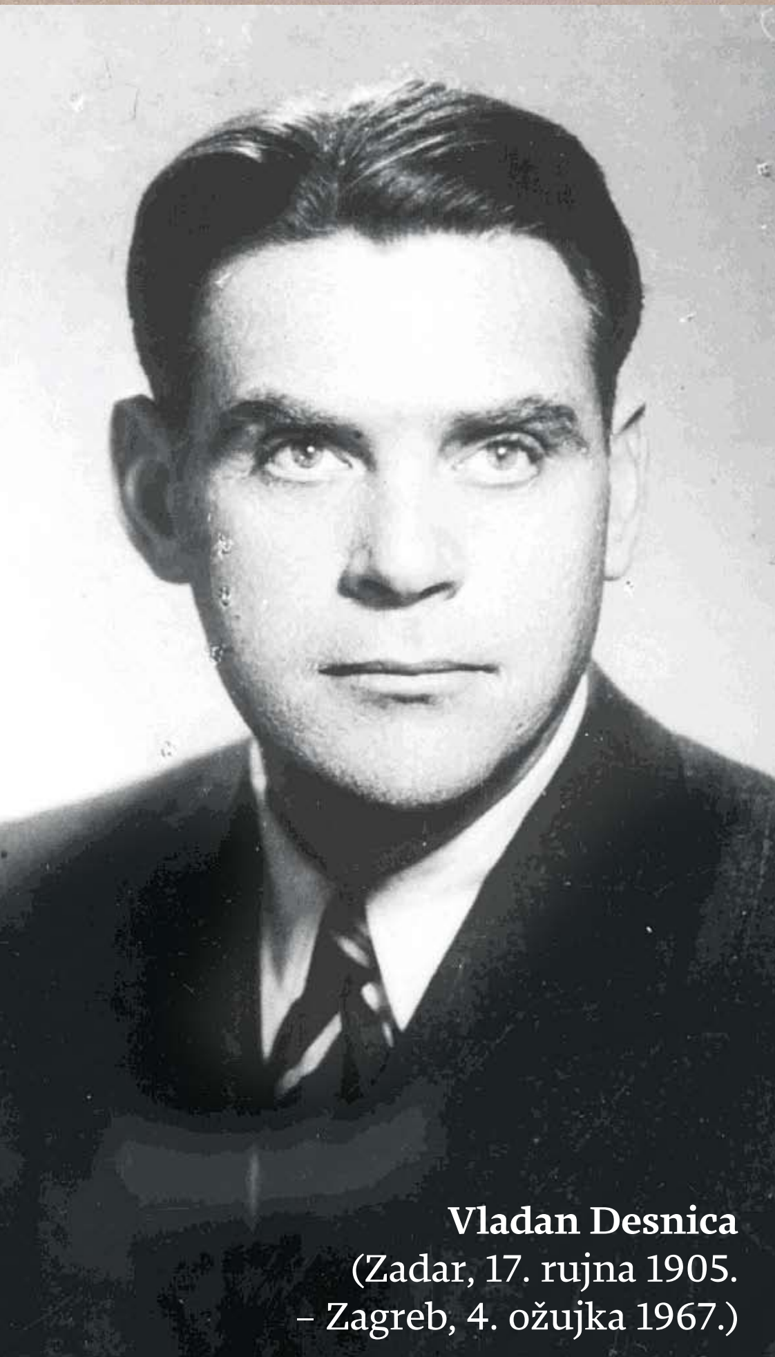
Vladan Desnica (Zadar, 17. rujna 1905. – Zagreb, 4. ožujka 1967.)

(Vladan Desnica, Zimsko ljetovanje , Zagreb 1974., str. 94.)