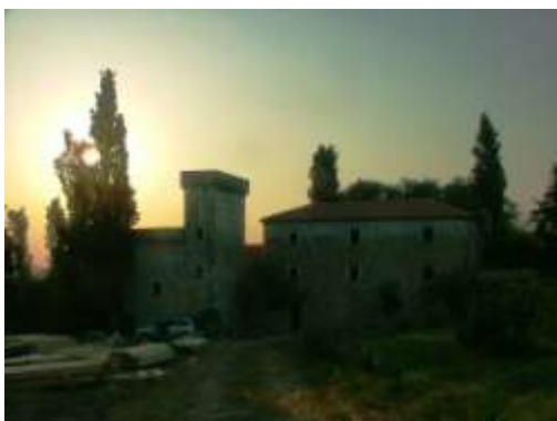
Kula Jankovića u smiraj dana

- 12 sudionica iz Belgije iz Francuske, organiziranih putem skautske organizacije....), te jedna sudionica iz Francuske (preko agencije Rempart?):