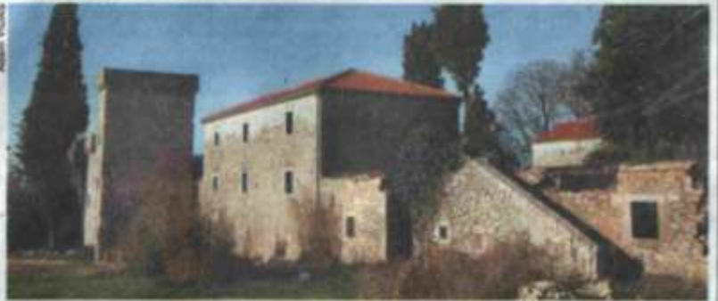
Osim rada u arboretumu Kule, mladi iz Europe će imati priliku upoznati arheološko i etnološko naslijeđe ovog kraja