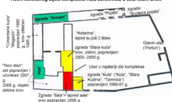
Prostorije koje su volonterke očistile 2008 g. (zeleno)