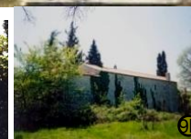
'Magazin', sa istoka Kotarina – kukurušnjak sada u obnovi