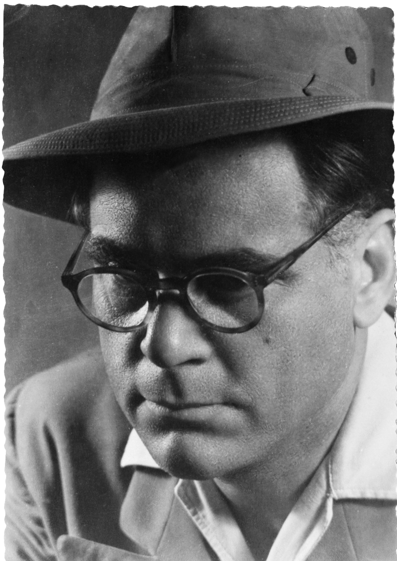
Vladan Desnica (Zadar, 17. rujna 1905. – Zagreb, 4. ožujka 1967.)